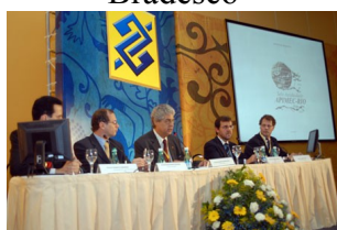
Banco do Brasil