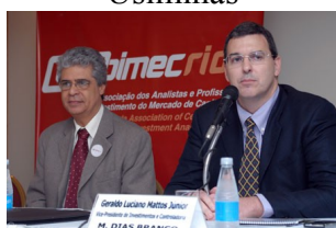
M. Dias Branco